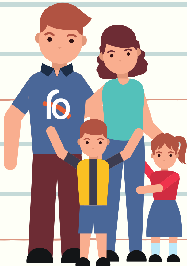
Alumnado con algún conviviente con FQ

CONSULTAR CON LA UNIDAD DE FQ CADA CASO PARTICULAR MASCARILLA FFP2/KN95 O QUIRÚRGICA (SEGÚN TOLERANCIA) HIGIENE DE MANOS CADA 1-2H DISTANCIA INTERPERSONAL DE 1,5 METROS AULAS BIEN VENTILADAS LIMPIEZA DE SUPERFICIES DOS VECES AL DÍA AL LLEGAR A CASA, HACER UNA LIMPIEZA DEL CALZADO, CAMBIO DE ROPA E HIGIENE PERSONAL.