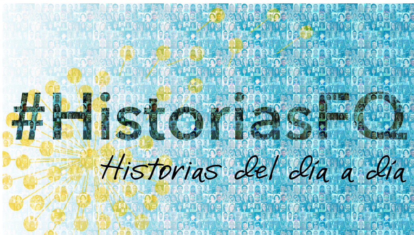
'El día a día con FQ'

La fibrosis quística es una enfermedad genética, que hace que el cuerpo produzca una mucosidad espesa que se acumula y obstruye los conductos de los pulmones, el tracto digestivo y/o el páncreas. Esta acumulación de moco puede causar infecciones graves, y a veces fatales, como así también la mala absorción de nutrientes, y puede afectar las glándulas sudoríparas y el sistema reproductor masculino.